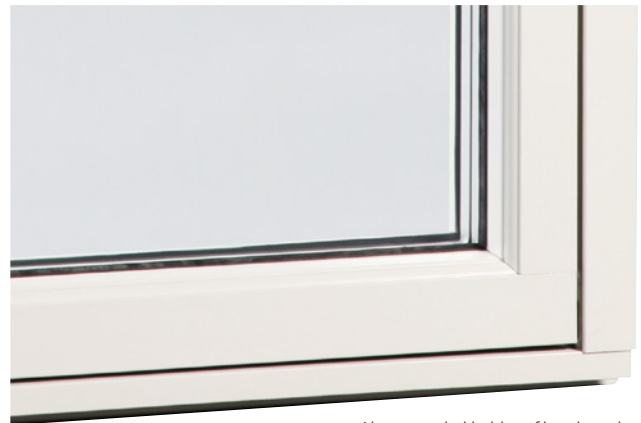
Aluminiumbeklädd profilerad utsida

Fönster med beslag som gör det möjligt att vrida runt fönsterbågen 180 grader så att fönstrets utsida hamnar inåt rummet. Fönstret levereras alltid med utfallsspärr som kräver två händer för att öppnas. Läs mer om våra produkter på outline.se