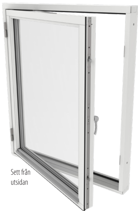
Sett från utsidan

Utåtgående sidhängt fönster. Levereras med fönsterbroms i ett luft, vilket förenklar vädring. Finns med 1-luft, 2-luft och 3-luft i en karm. Vid beställning av 1-luft måste gångjärnssida anges. Nedan visas bilder sett från insidan. Läs mer om våra produkter på outline.se